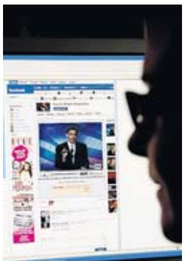
I "hemlandet" USA tycks nu den tidigare så starka Facebooktrenden ha vänt.